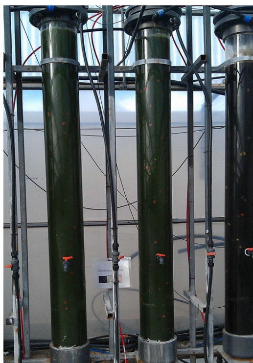
Figura 2. Cultivo de microalgas en columnas de burbujeo en condiciones reales de producción