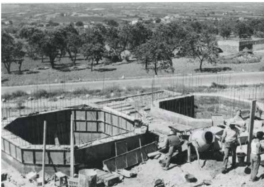
CONSTRUINT ELS "COSEDEROS"

L'any 1967 s'aconsegueix un equilibri patrimonial de la Bodega Cooperativa. A efectes de comptabilitat vol dir que el patrimoni conformat per: la maquinària, el transformador i l'immoble sumen un total de 5.000.000 ptes. que està compensat pel capital, les reserves i el benefici de l'exercici que també donen tots tres el resultat de 5.000.000 ptes; els préstecs bancaris estan solucionats pels diners existents en caixa i bancs. Aquest fet