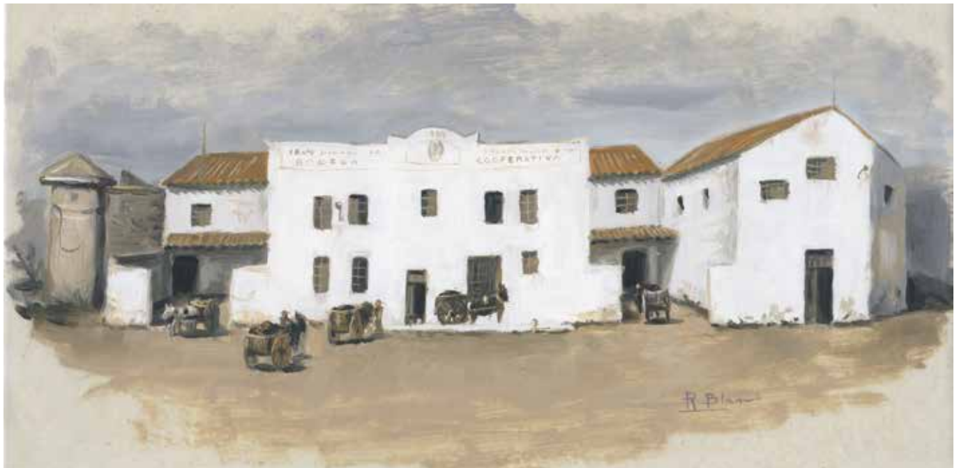
ACTIVITAT ALS ANYS SEIXANTA

El Govern cancel·la la línia de crèdits als Grups de Colonització, decantant-se per impulsar els Plans de Desenvolupament Nacionals. Per fer front al problema sorgit es recorre a la Caixa Rural de Vilafamés i l'organització de les cooperatives agrícoles. Així s'obri un compte bancari i s'obté un préstec de 2.000.000 de pessetes en la Caixa Rural Provincial, quedant així solucionada la línia de finançament.