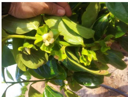
Foto 1.- Flores femeninas.

En el caqui podemos encontrar 3 tipos de flores: femeninas o pistiladas, masculinas o estaminadas y hermafroditas (con pistilos y estambres en la misma flor). Las femeninas las encontramos en las axilas de las hojas, son flores solitarias y de gran tamaño. Las masculinas y hermafroditas se encuentran en grupos de 2 o 3 flores y son de menor tamaño que las femeninas. Existen variedades de caqui que solamente producen flores femeninas, otras producen femeninas y masculinas y otras femeninas, masculinas y hermafroditas.