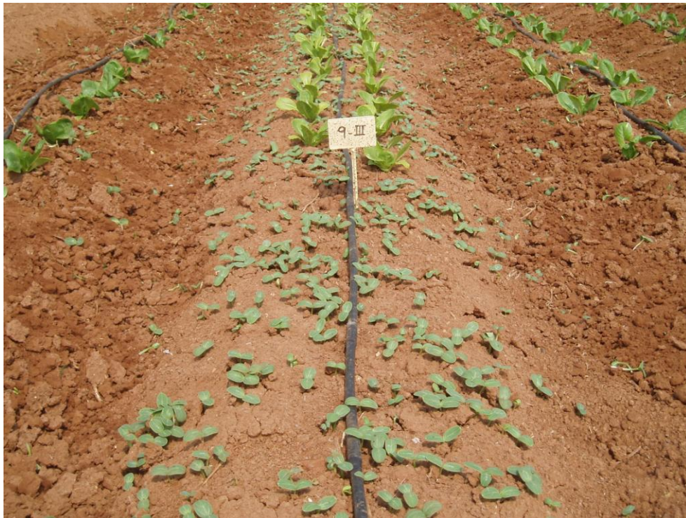
Foto 4.- Problemas de malas hierbas con polinizadores desechables.

En ensayos realizados en el Centro de Experiencias de Cajamar en Paiporta se ha podido comprobar el buen funcionamiento de todos los polinizadores, no detectándose diferencias claras en la producción del cv. triploide al que polinizan, en la calidad, ni en el peso medio de los frutos.