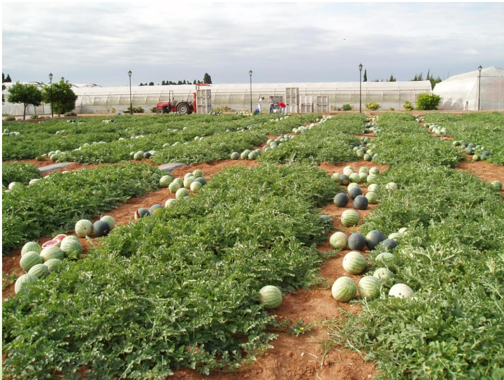
Foto3.- Sandías con distinto aspecto exterior. Cv triploide rayado y polinizador de color oscuro.